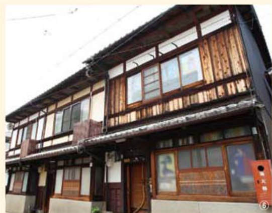
⑤ 玄関から続く土間の空間には、大重さんがこだわった砂利が敷き詰められている。楽しみいっぱいの玄関。 ⑥ 三軒長屋の京らしい佇まいが印象的。