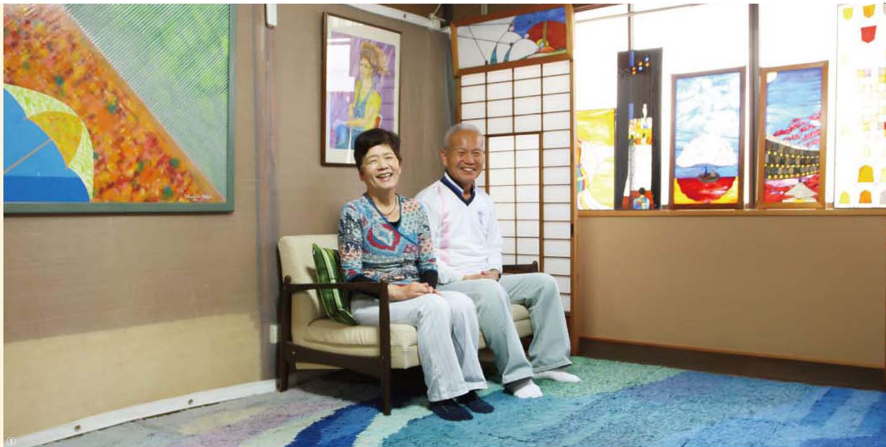
① 大重さんの作った作品がずらりと並び2階。広々とした空間には、明るい日差しが差しこんでいる。