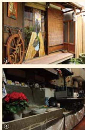
② 光が射し込む坪庭には、遊び心たっぷりのオブジェがいっぱい。四季を感じる豊かな時間を楽しめる、とっておきの場所。 ③・④ 京町家ならではの火袋が印象的な台所には、おどさんの面影が。昔ながらを大切に、使いやすさも重視。